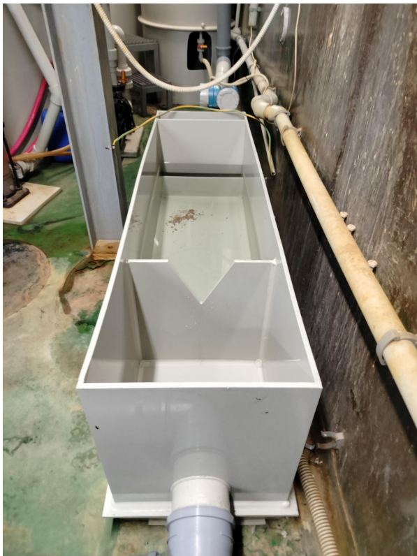
LIV Systems d.o.o. - Širša okolica MMV1

Odpadna voda na iztoku V1 (Odtok V1-1) - po predčiščenju na IČN odpadnih vod z zbiralniki koncentratov MMV1